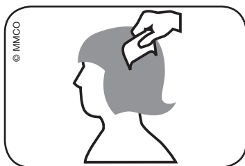
Abb. Durchkämmen des nassen Haars mit Lauskamm: vom Haaransatz bis zu den Haarspitzen